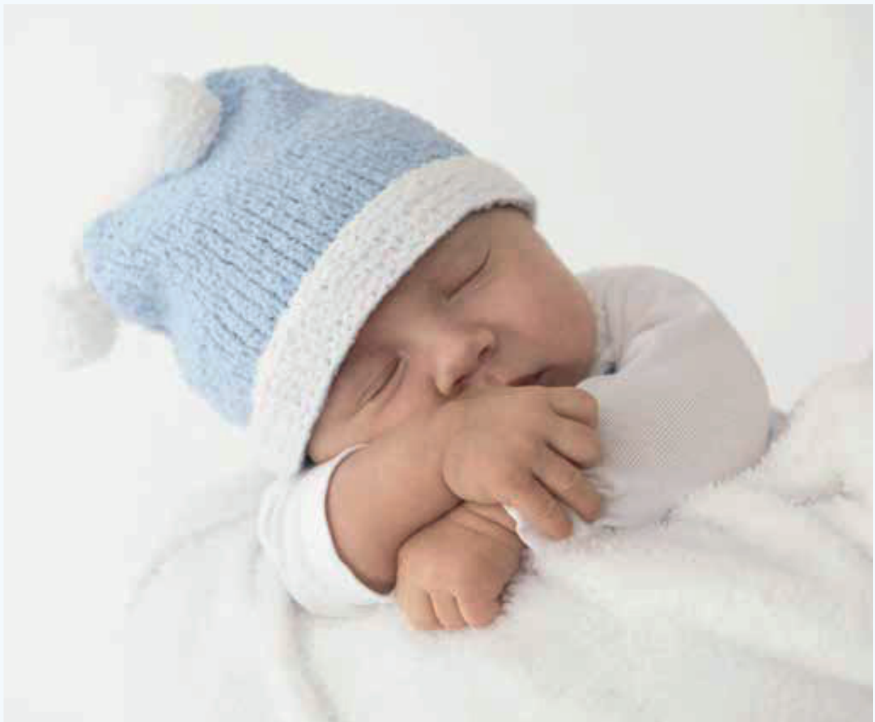
MODEL 01, 02, 03 & 04 Kruippakje, vestje, muts & schoentjes BABYSOFT .